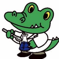
大阪大学公式マスコットキャラクター 「ワニ博士」薬学部の頃

大阪大学 薬学部事務室（教務係） E-mail:yakugaku-kyoumu@office.osaka-u.ac.jp TEL: 06-6879-8146